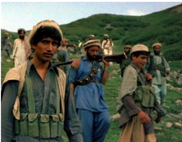
Моджахеда переходят афгано-пакистанскую границу, 1985 год

Они осуществляли террористические акты и диверсии — наносили ракетные удары по военным гарнизонам и авиации советских войск, минировали стратегические трассы и дороги, устраивали засады, обстреливая колонны продовольственных, гуманитарных и военных грузов.